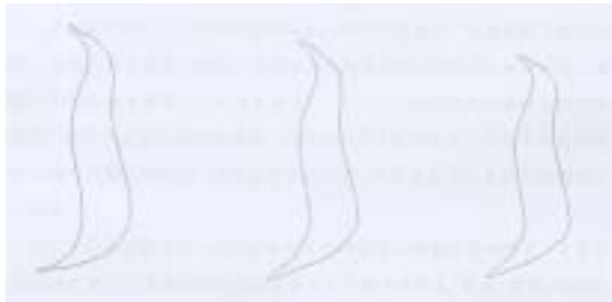
圖六: 平均 3D 投影剖線由左至右分別為 L, M, S 尺碼