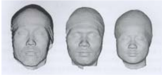
圖五: 最小差異之群組樣本人: 由左至右分別為 L, M, S 尺碼