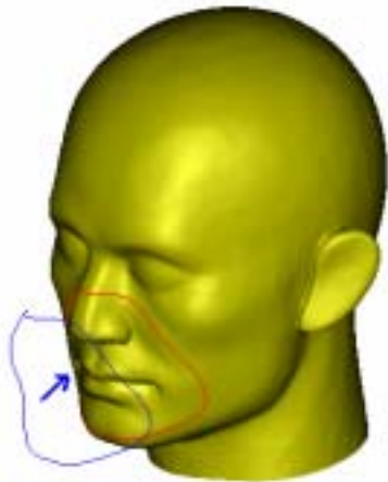
圖三: 3D 臉部投影輪廓線