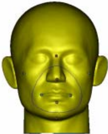
圖四: 2D 投影輪廓線之建構